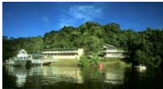
Station de recherche de Barro Colorado Island