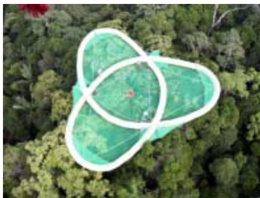
Version Solvin-Bretzel du Radeau des Cimes