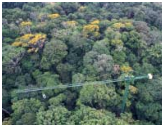
Grue du STRI, dans la forêt de San Lorenzo

Les interprétations des résultats seront facilitées par la réalisation conjointe de suivis de certaines caractéristiques écologiques de chaque site étudié (végétation, structure de la canopée, caractéristique du sol, niveau de décomposition de la litière, etc.).