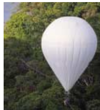
La Bulle des Cimes