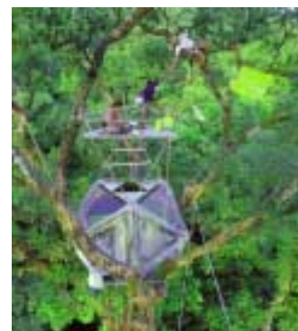
L'Ikos, station modulaire